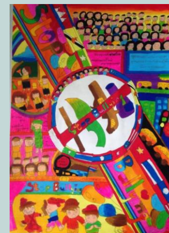
ภาพโดย ด.ญ.ชนิกานต์ ชูแก้ว ชั้น ป.5 โรงเรียนบ้านทุ่งมะขามป้อม จ.ตรัง

และนอกห้องเรียน จะช่วยลดความรุนแรงของปัญหา