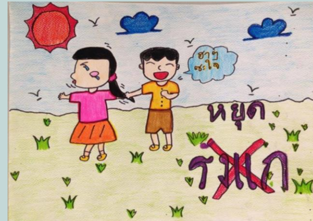
ภาพโดย ด.ญ.ปวันรัตน์ มะลิซ้อน ชั้นป.4 โรงเรียนวัดกลางคลองสระบัว