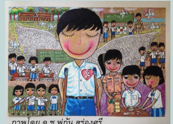
ภาพโดย ด.ช.พุทน์ สรวงศรี ชั้นป.4 โรงเรียนปิยะพงษ์วิทยา กทม.